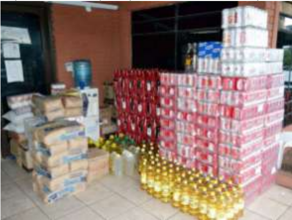
Mercaderías incautadas el 15 de mayo. Se indagará si los comercios tienen productos traídos ilegalmente.

El MIC verificará origen de artículos de supermercados -- El ministro de Industria y Comercio, Diego Zavala, tras explicar que la postura del gobierno nacional de regularizar la actividad de los pequeños comerciantes que traen mercaderías de zonas fronterizas, especialmente de Clorinda, Argentina, no significa que se pondrá fin a los controles en las fronteras, anunció que también se hará una verificación en los distintos comercios, incluyendo supermercados, para pedirles documentos y así saber de dónde se abastecen.